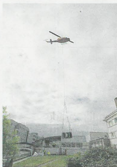
Une livraison millimétrée