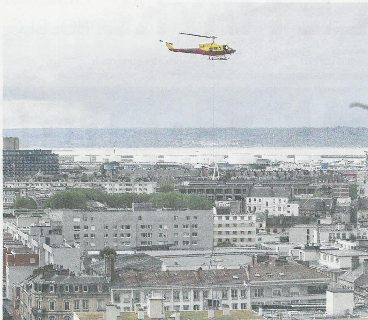
À 10 h, hier, première rotation de l'hélicoptère au-dessus du centre commercial. Les nouveaux équipements livrés ce dimanche répondent aux dernières normes environnementales internationales